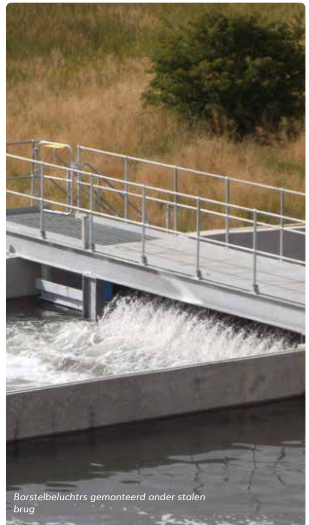
Borstelbeluchters gemonteerd onder stalen brug

Onze range aan borstelbeluchters omvat twee gestandaardiseerde types, de LANDY-700 en de LANDY-1000 respectievelijk met een diameter van 700 en 1000 mm. Lengtes variëren tot maximaal 9 meter. Op verzoek van de klant zijn afwijkende types eveneens leverbaar.